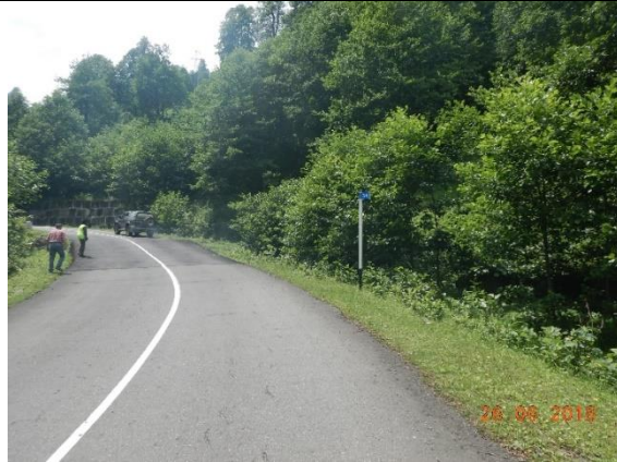
გზა კმ 34+000