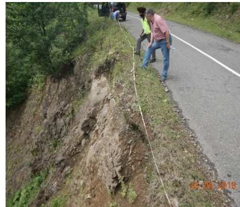
გზა კმ 48+020