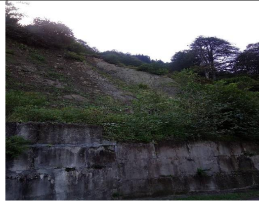
გზა კმ 34+420