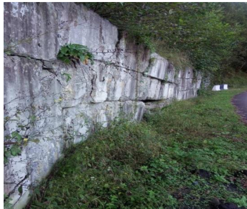
გზა კმ 34+850